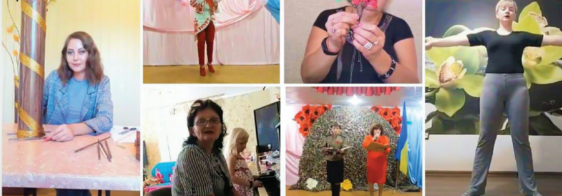
Під час карантину 2020 року культурні заходи в громаді перейшли в онлайн

Запрошуємо жителів громади до участі! Дізнавайтесь деталі у старост своїх округів. Давайте РАЗОМ наведемо лад у нашому домі!