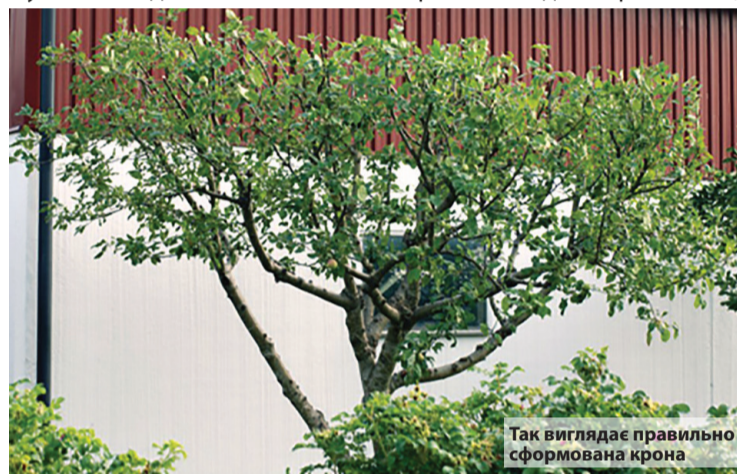
Так виглядає правильно сформована крона

Вкорочувальна обрізка проводиться для того, щоб призупинити надмірний ріст гілок, виключити загороджування однієї сильнішою