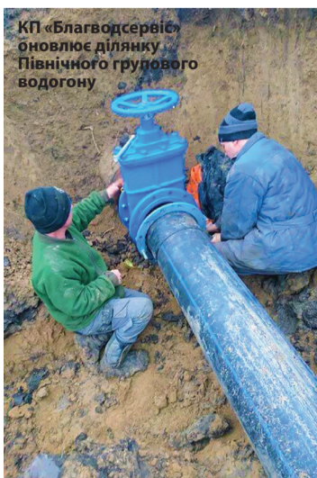
КП «Благводсервіс» оновлює ділянку Північного групового водогону

Серед проблем, з якими регулярно стикаються комунальники – стан автомобільної ремонтної техніки, яка потребує оновлення, збільшення обсягів сміття, яке щомісячно вивозиться на полігон, а також великий пробіг, який здійснює щодня сміттєвоз (це близько 200 кілометрів на день). Для того, щоб оптимізувати маршрут, а також зменшити навантаження на техніку, в планах