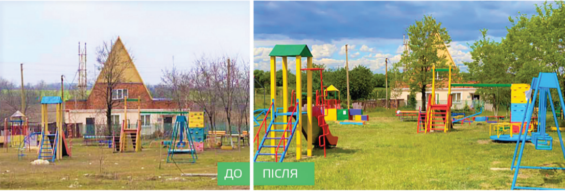
Свій голос за проекти Громадського бюджету віддав кожен п'ятий житель громади (на фото оновлений майданчик в с.Дніпрельстан)

Комунальні підприємства та установи громади підбивають підсумки роботи у 2020 році