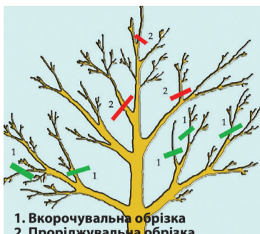
1. Вкорочувальна обрізка 2. Проріджувальна обрізка

Правильне і своєчасне обрізання плодкових дерев весною дозволяє отримати хороший урожай, крім того рослини будуть рости здоровими та сильними. Це обумовлено тим, що під час обрізки видаляються слабкі, хворі та погано розвинені гілки, а здорові і сильні отримують більше необхідних живильних речовин. Обрізка омолоджує дерево, збільшує врожайність, стимулює ріст нових гілок. Найкращим часом для обрізки плодкових дерев вважається кінець зими або початок весни, адже в цей час рослини ще не прокинулися, але ось-ось почнеться період швидкого росту. У цій статті дізнаємось як правильно обрізати дерева весною, для чого це робити, та коли найкраще проводити таку процедуру.