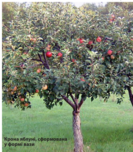
Крона яблуні, сформована у формі вази

Не варто так само проводити обрізання у вологу погоду, після дощу і рано вранці після випадання роси, так як це теж сприятиме рознесенню хвороб і інфікування рослин. Якщо ви обрізаєте рослини і помітили ознаки, якого-не-