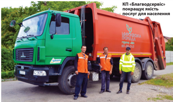
КП «Благводсервіс» покращує якість послуг для населення

підприємства на 2021 рік – закупівля ще одного сміттєвозу. Для розширення ж географії надання послуги для жителів населених пунктів Миколай-Пільського та Новопетрівського округів КП придбає та розставить нові сміттєві контейнери.