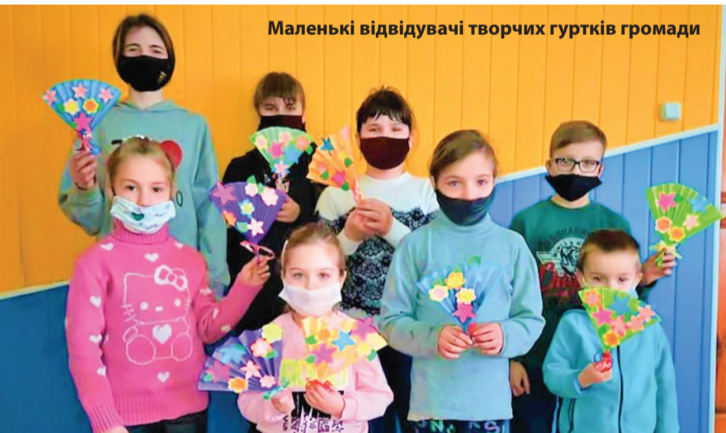
Маленькі відвідувачі творчих гуртків громади