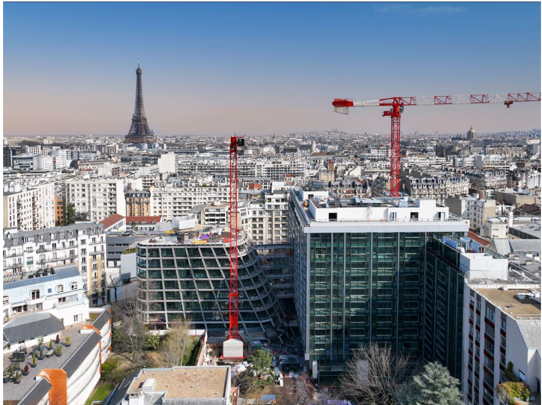
Biome – Paris 15 e